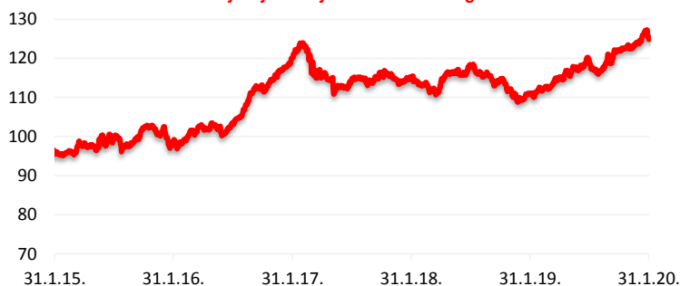
Kretanje cijene udjela HPB Dioničkog fonda

Cilj fonda je ostvarivanje porasta vrijednosti udjela kroz duži vremenski period s ciljanom strukturom ulaganja sredstava primarno u dionice, uvažavajući načela sigurnosti, raznolikosti i likvidnosti ulaganja imovine Fonda te prilagođavajući investicijsku politiku situaciji na tržištu. Fond će prikupljena sredstva ulagati u financijske instrumente isključivo čiji je izdavatelj ili za koji jamči Republika Hrvatska, države članice EU, OECD i CEFTA i čiji je izdavatelj iz Republike Hrvatske, države članice EU, OECD i CEFTA. Društvo koristi aktivnu strategiju upravljanja Fondom, uz potpunu diskreciju ulaganja imovine Fonda te ne koristi referentne vrijednosti (benchmark).