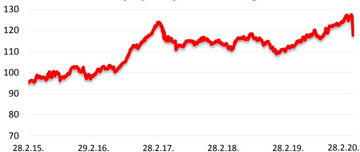
Kretanje cijene udjela HPB Dioničkog fonda

Cilj fonda je ostvarivanje porasta vrijednosti udjela kroz duži vremenski period s ciljanom strukturom ulaganja sredstava primarno u dionice, uvažavajući načela sigurnosti, raznolikosti i likvidnosti ulaganja imovine Fonda te prilagođavajući investicijsku politiku situaciji na tržištu. Fond će prikupljena sredstva ulagati u financijske instrumente isključivo čiji je izdavatelj ili za koji jamči Republika Hrvatska, države članice EU, OECD i CEFTA i čiji je izdavatelj iz Republike Hrvatske, države članice EU, OECD i CEFTA. Društvo koristi aktivnu strategiju upravljanja Fondom, uz potpunu diskreciju ulaganja imovine Fonda te ne koristi referentne vrijednosti (benchmark).