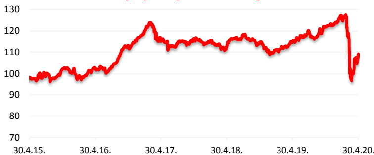
Kretanje cijene udjela HPB Dioničkog fonda

Cilj fonda je ostvarivanje porasta vrijednosti udjela kroz duži vremenski period s ciljanom strukturom ulaganja sredstava primarno u dionice, uvažavajući načela sigurnosti, raznolikosti i likvidnosti ulaganja imovine Fonda te prilagođavajući investicijsku politiku situaciji na tržištu. Fond će prikupljena sredstva ulagati u financijske instrumente isključivo čiji je izdavatelj ili za koji jamči Republika Hrvatska, države članice EU, OECD i CEFTA i čiji je izdavatelj iz Republike Hrvatske, države članice EU, OECD i CEFTA. Društvo koristi aktivnu strategiju upravljanja Fondom, uz potpunu diskreciju ulaganja imovine Fonda te ne koristi referentne vrijednosti (benchmark).