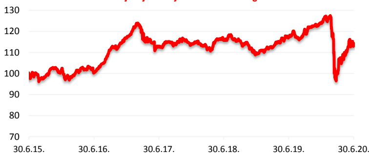
Kretanje cijene udjela HPB Dioničkog fonda

Cilj fonda je ostvarivanje porasta vrijednosti udjela kroz duži vremenski period s ciljanom strukturom ulaganja sredstava primarno u dionice, uvažavajući načela sigurnosti, raznolikosti i likvidnosti ulaganja imovine Fonda te prilagođavajući investicijsku politiku situaciji na tržištu. Fond će prikupljena sredstva ulagati u financijske instrumente isključivo čiji je izdavatelj ili za koji jamči Republika Hrvatska, države članice EU, OECD i CEFTA i čiji je izdavatelj iz Republike Hrvatske, države članice EU, OECD i CEFTA. Društvo koristi aktivnu strategiju upravljanja Fondom, uz potpunu diskreciju ulaganja imovine Fonda te ne koristi referentne vrijednosti (benchmark).