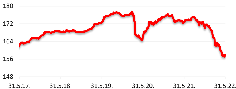
Kretanje cijene udjela HPB Obvezničkog fonda

Cilj fonda je ostvarivanje stabilnog porasta vrijednosti udjela kroz duži vremenski period s ciljanom strukturom ulaganja primarno u obveznice. Fond će prikupljena sredstva ulagati u financijske instrumente isključivo čiji je izdavalatelj ili za koji jamči Republika Hrvatska, države članice EU, OECD i CEFTA i čiji je izdavalatelj iz Republike Hrvatske, države članice EU, OECD i CEFTA. Imovina HPB Obvezničkog fonda uložena je u instrumente novčanog i obvezničkog tržišta u omjeru ne manjom od 75% imovine fonda. Društvo koristi aktivnu strategiju upravljanja Fondom, uz potpunu diskreciju ulaganja imovine Fonda te ne koristi referentne vrijednosti (benchmark).